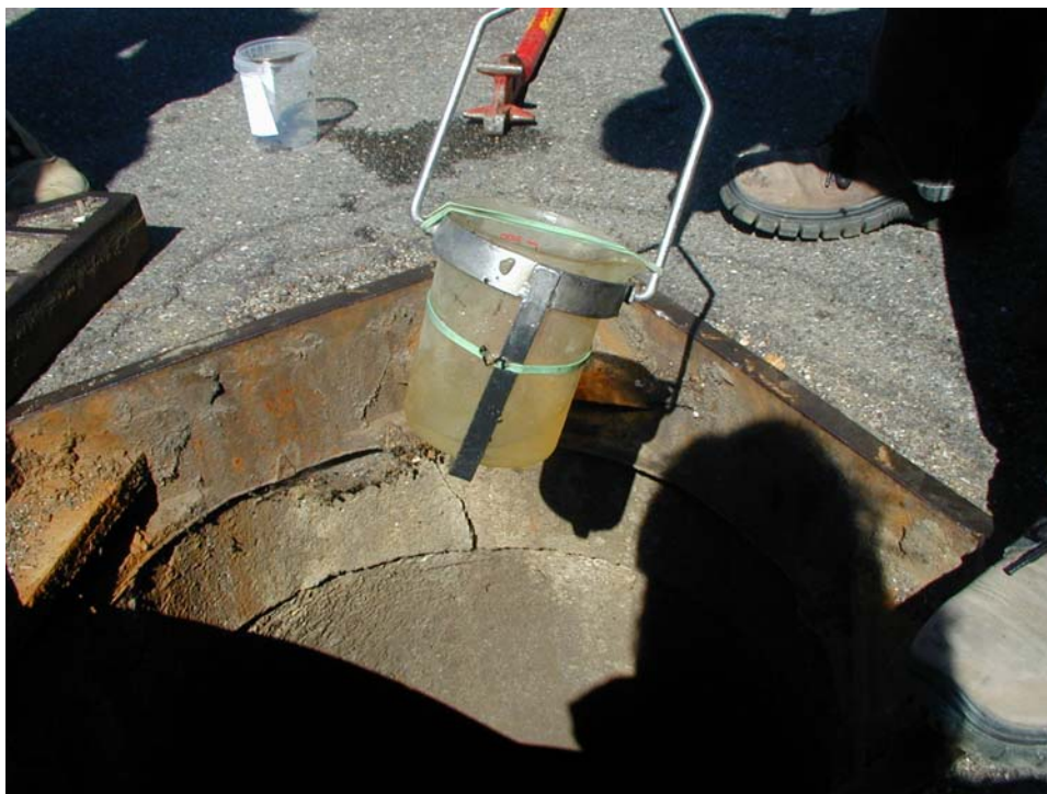
Figur 2.1 Prøvetagning af biofilm i Brønd 500 i Gladsaxe Erhvervsvarter. Til prøvetagningen blev anvendt et fastspændt glas på en teleskopstang, som kan skrabe sider og bund af kloakrøret. Biofilmen blev efterfølgende opsamlet i et plastikbæger (vist i baggrunden).